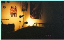
ティーンエイジャールーム