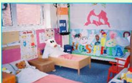
プレバレーション 家族サポート・地域訪問