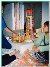
マルチセンサリー ルーム