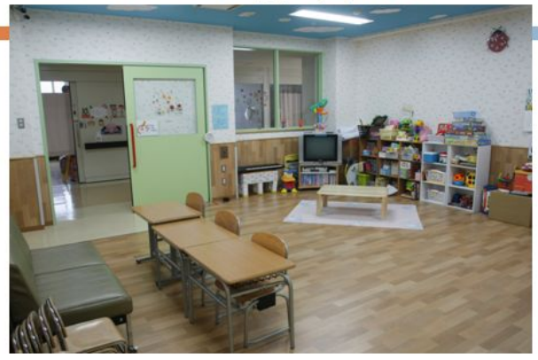
プレイルーム全景:東側から