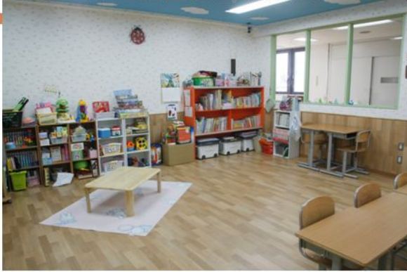
プレイルーム全景:西側から