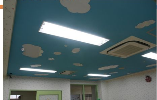
プレイルーム天井