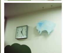
千葉こども病院 こども・家族支援室 改装プロジェクト