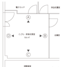
千葉こども病院 こども・家族支援室 改装プロジェクト